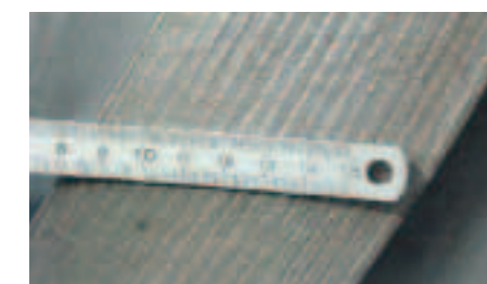
Tableau Récapitulatif : Technopoudres